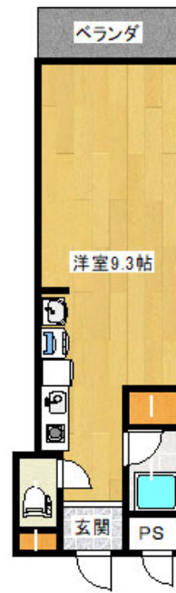
402号 24.0㎡ 洋9.3