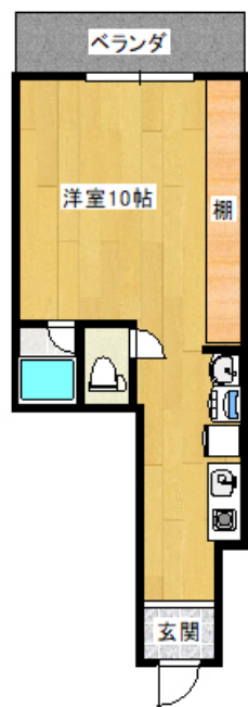
301号 23.0㎡ 洋10